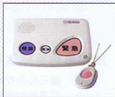
緊急コール用端末本体(左)と