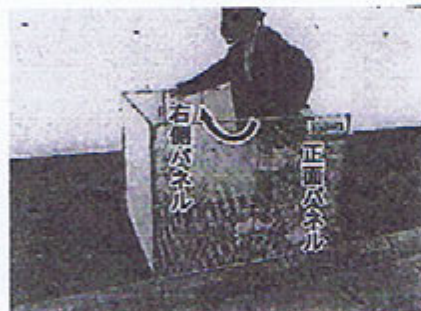
②右側パネルを奥にたたみます