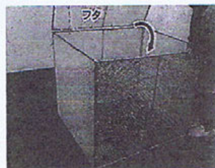
③フタを降ろして完成