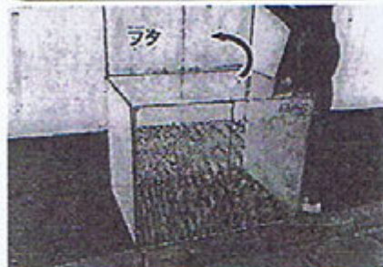
①フタを後ろに倒します