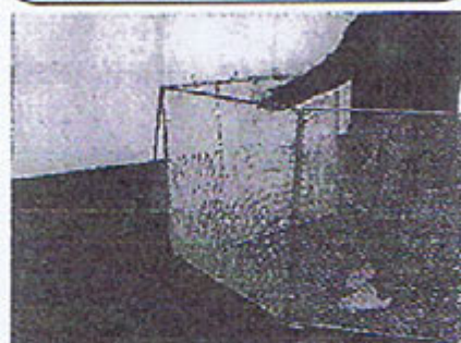
①写真のように開きます