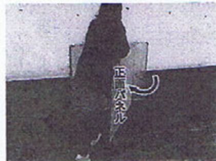
③左側パネルもたたみ 正面パネルを反転させます