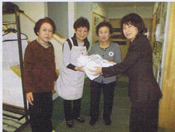
幌北まちづくりセンターへ寄贈(H28.10.13)