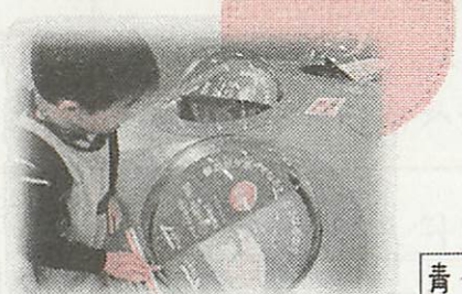
青少年科学館でプラネタリウム観賞♪