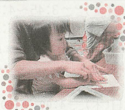
手形スタンプでおめでとう! ※9月実施「敬老の日」工作より

幌北児童会館の子育てサロンでは、楽しくおもちゃで遊んだり親子で交流したりするほかに、工作をして遊ぶこともあります。子どもの目の前には“こいのぼり”、敬老の日が近くなったら“おじいちゃんおばあちゃんへの手紙”など季節に合わせた工作になっています。他には水遊びやシャボン玉あそびも暖かい季節に行っています♪12月のクリスマス会ではサンタさんから新しいおもちゃのプレゼントが届きました。ぜひ遊びに来てくださいね☆