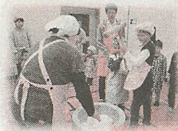
「ヨイショ!」のかけ声で