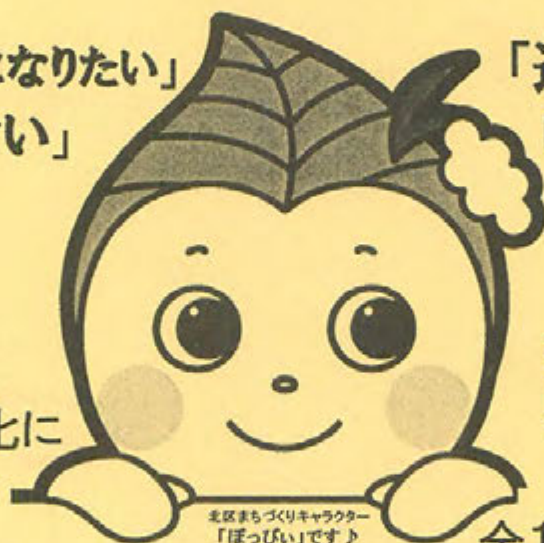
北区まちづくりキャラクター 「ぽっぴい」です。