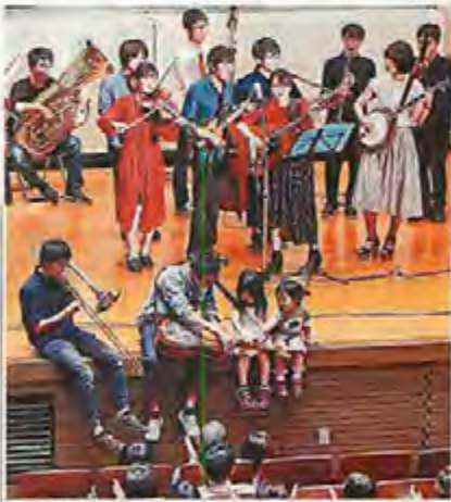
初のクラーク大サーカスで演奏を披露する北大生たち

北大生による音楽や落語のステージイベント「第1回クラーク大サーカス」が30日、札幌市北区の北大クラーク会館で開かれた。市民に北大へ観覧んでもらおうと、複数のサークルが手作りで企画し、約200人が観覧を楽しんだ。