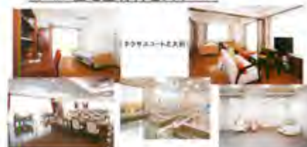
③ b. 住宅型有料老人ホーム