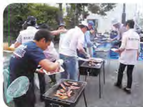
バーベキュー大会