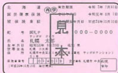
札幌市国民健康保険証(見本)