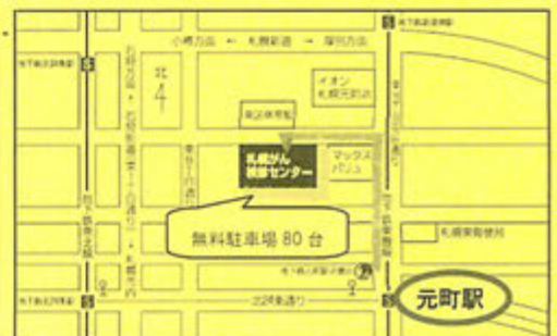
地下鉄東豊線「元町」2番出口から徒歩7分