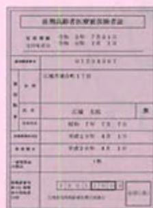
後期高齢者医療被保険者証(見本)

※ 社会保険被扶養者の方など、札幌市の国保・後期高齢以外の方は 札幌がん検診センターへ直接お申し込みください。