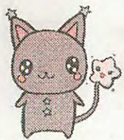
札幌市幌北児童会館キャラクター ほっぴい