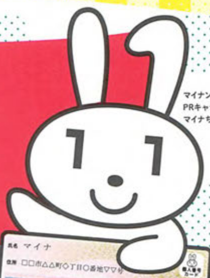
マイナンバー PRキャラクター マイナちゃん

※初めて申請する方が対象です。 ※本人限定受取郵便にて郵送します。 必要書類をご持参されなかった場合は、後日区役所での受け取りとなります。