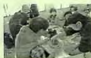
作品のお渡しは、約1か月後