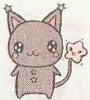
幌北児童会館キャラクター ほっぴい