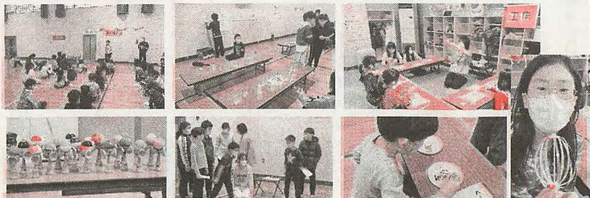
「あそびフェス」いろいろな遊びができたね！わんぱくさんも企画コーナーを二つ作り頑張りました！