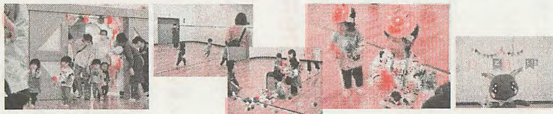
子育てサロンは「運動会」をしましたよ！元気に入場行進！かけっこ・玉入れ・お遊戯たのしかったよ！ 最後は、民生主任児童委員さんがボランティアに来ていたので、メダルをかけてもらいました！