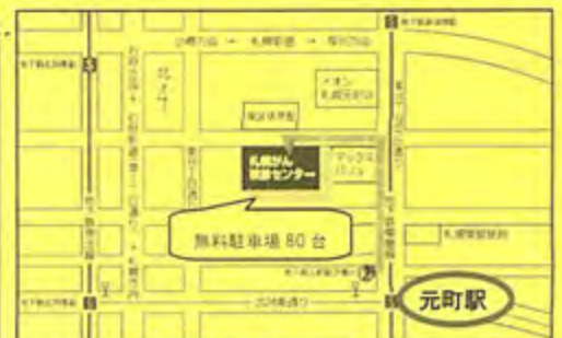
地下鉄東豊線「元町」2番出口から徒歩7分