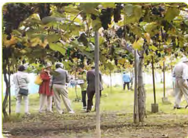
ブドウ狩りレクリエーション

令和5年度は、コロナの制限も解けて以前のよ うに町内活動ができることを願っております。