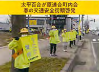
太平百合が原連合町内会 春の交通安全街頭啓発