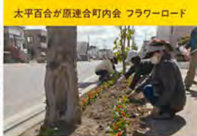
太平百合が原連合町内会 フラワーロード