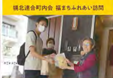
梶北連合町内会 福まちふれあい訪問