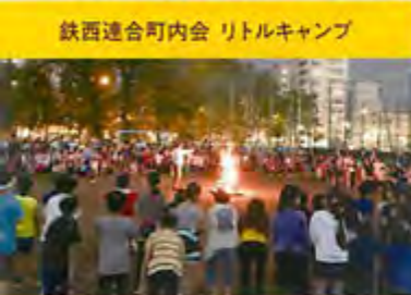
鉄西連合町内会 リトルキャンプ