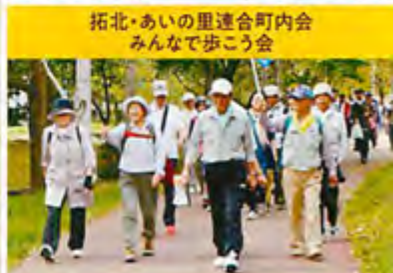
拓北・あいの里連合町内会 みんなで歩こう会