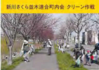
新川さくら並木連合町内会 クリーン作戦