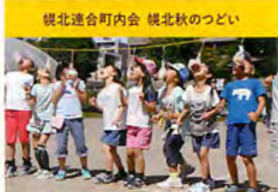
梶北連合町内会 梶北秋のついで