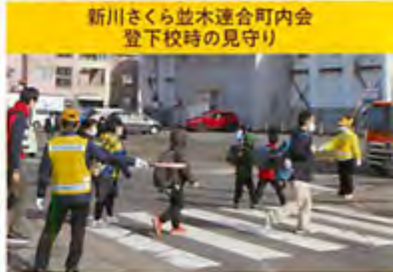
新川さくら並木連合町内会 登下校時の見守り