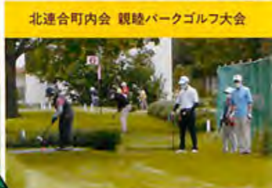
北連合町内会 観覧パークゴルフ大会