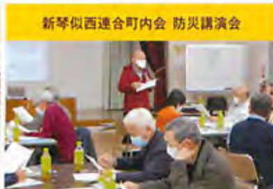
新琴似西連合町内会 防災講演会