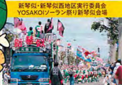
新琴似・新琴似西部地区実行委員会 YOSAKOIソーラン祭り新琴似会場