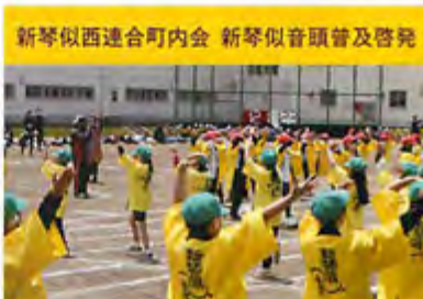
新琴似西連合町内会 新琴似音頭普及啓発