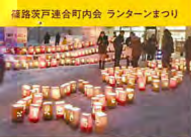
福路茨戸連合町内会 ランタンまつり