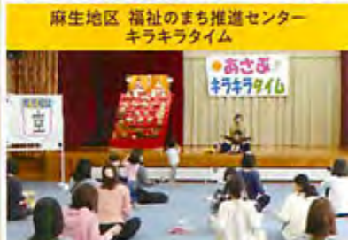
麻生地区 福祉のまち推進センター キラキラタイム