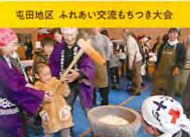
屯田地区 ふれあい交流もちつき大会