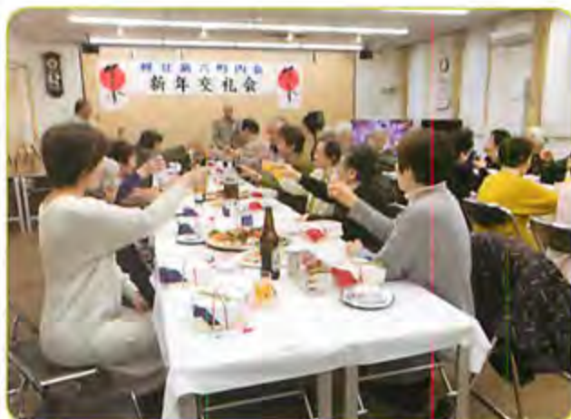
町内会新年交礼会