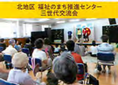
北地区 福祉のまち推進センター 三世代交流会