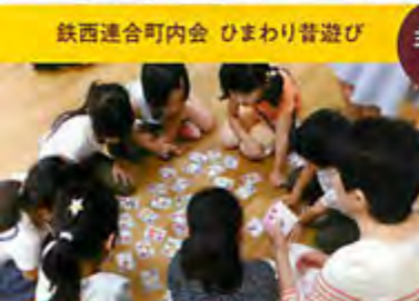
鉄西連合町内会 ひまわり普遊び