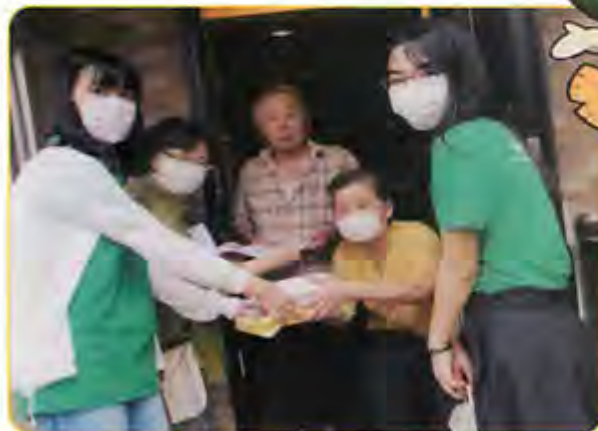
ネオロスのふれあい訪問参加