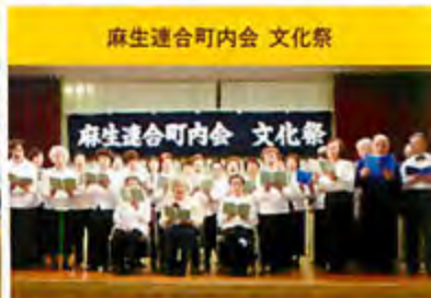
麻生連合町内会 文化祭