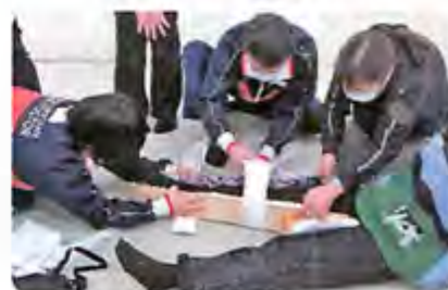
救急法の講習(救急法養成講習)