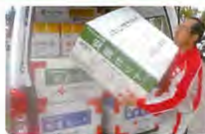
救援物資の搬入(胆振東部地震)