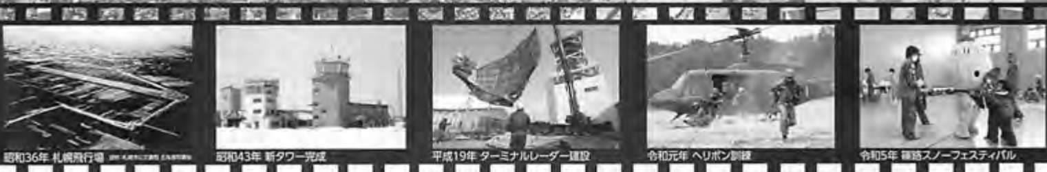
昭和36年 札幌飛行場