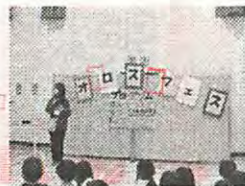
「ネオロスフェス」では地域の方のボランティアも。北辰中学校科学部展も行い、中学生の説明を熱心に聞く姿も。おみくじを引いておめっかみ！おみくじのサイズも中身も子どもたちがネオロスメンバーと決めました。どんないいこと書いてあったかな？