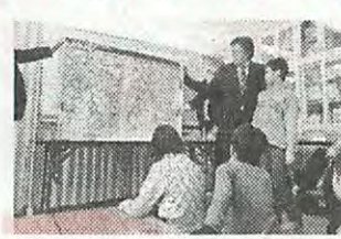
幌北地区の防災マップで災害別の危険な場所を探したよ。「めざせ！ぼうさいゆうしゃ」 協力：(一社)建設コンサルタンツ協会