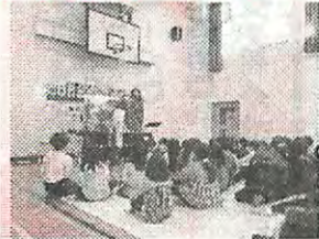
読み聞かせボランティア「SKY」さんによる大型絵本。驚いたり笑ったり。実際のシベリア抑留の方のお話を元にした絵本では真剣に聞き入る姿も。