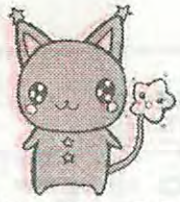
幌北児童会館キャラクター ほっぴい