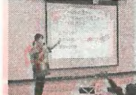
(株)明治によるチョコレート教室。マールチョコのケースで万華鏡も作りました！