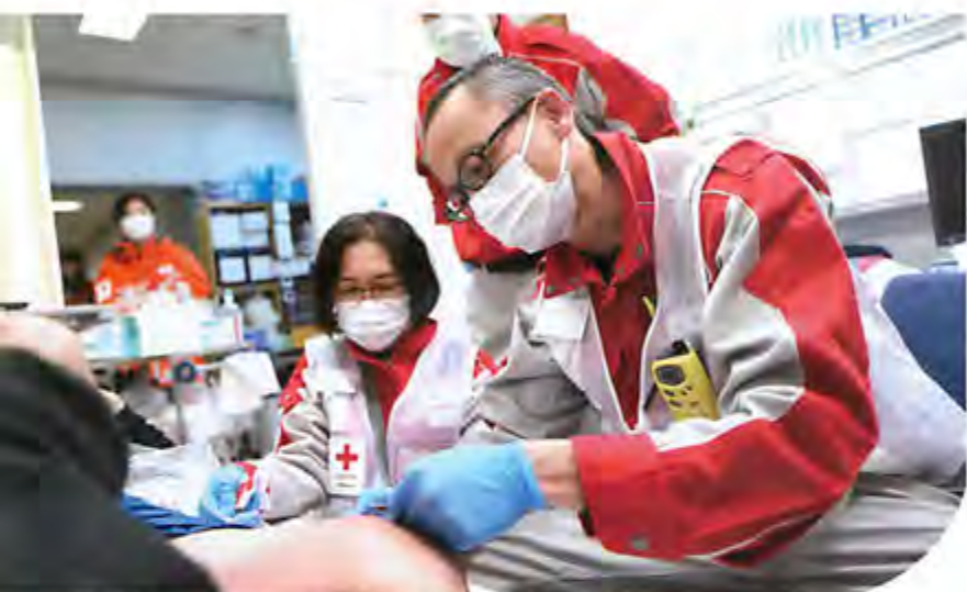
令和6年能登半島地震における救護活動の様子