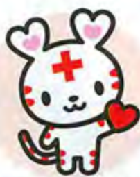
日本赤十字社公式キャラクター 「ハートラちゃん」

日本赤十字社は、災害救護活動などを行う民間の法人です。 その活動は、国や地方自治体からの補助金ではなく、