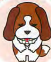
日本赤十字社北海道支部 マスコットキャラクター 「アンリー」