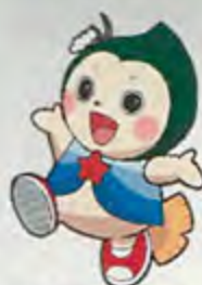
北区まちづくりキャラクター 「ほっぴい」

きれいに植えられた街路樹ますの花、いつの間にか無くなっている道路のごみ、冬道のツルツル歩道にまかされている砂、それらは町内会や各団体・企業をはじめ、地域の協力により実現しています。今号では、それらのうち最近の活動の一部を紹介します。