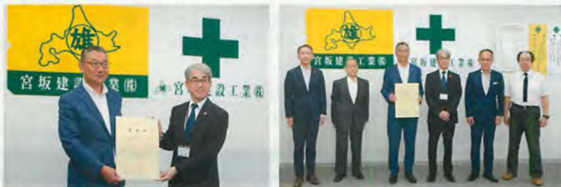
▲ 7月31日、広部札幌支社長に感謝状贈呈