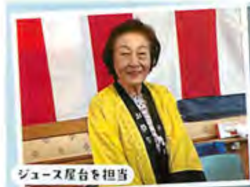
ジュース屋台を担当