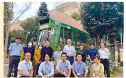
札幌サンプラザの市電前で