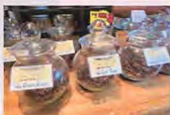
▲札幌の山の名前のオリジナルブレンド