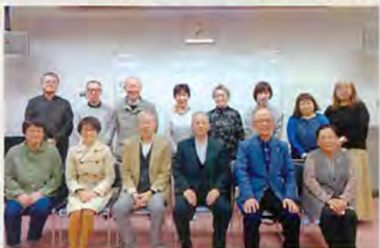
▲拓北・あいの里地区社協役員の方皆さん