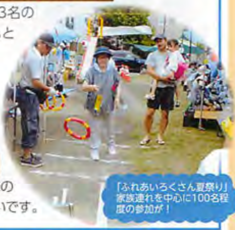
「ふれあいろくさん夏祭り」家族連れを中心に100名程度の参加が!

「福祉の会」では13名の福祉推進員が中心となってサロン「出かけませんか!」を開催しています。サロンへのお誘いも兼