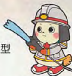
北区まちづくりキャラクター 「ほっぴい」

幌北地区では、町内会や各団体等が様々な活動を行っています。 今号では、今年度実施された防災・交通安全に関する活動や、地域密着型のボランティアサークル「ネオロス幌北」へのインタビューを紹介します。