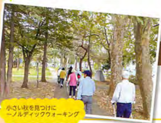
小さい秋を見つけに～ノルディックウォーキング

若い人にもたくさん活動に参加していただき、新しい考えも取り入れて、みんなが住みやすい町内会づくりを続けていきます。ゆくゆくは若い人にも役員を務めていただき、もっと活発な町内会にしたいです。