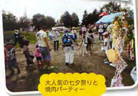
大人気の七夕祭りと焼肉パーティー