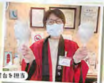
線あめ屋台を担当

あなたにとってボランティア活動とは? ボランティアは「自分のため」だと思います。元気なうちは活動を続けていきたいですね!