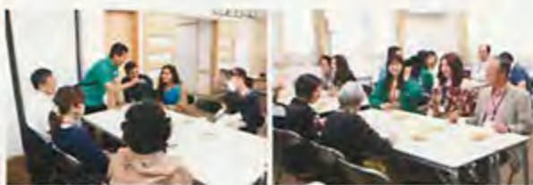
▲グループに分かれて自己紹介