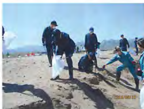
▲強い日差しの中、活動中の生徒の皆さん

SDGsを学習し、環境保全やリサイクル活動に興味をもつこと、関連する企業や地域社会とのつながりをもつとともに、活動で学んだことを地域社会に還元することが目標です。