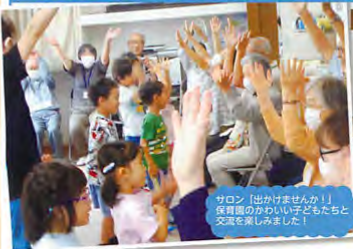
サロン「出かけませんか!」保育園のかわいい子どもたちと交流を楽しみました!