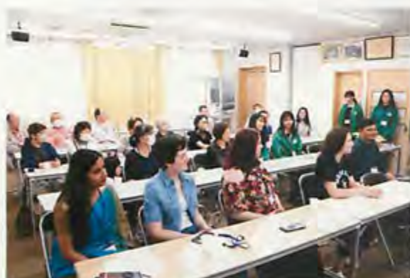
▲留学生交流会 様々な国の文化について学びました

伊東： 最初は、私たちが受講している授業に出席している留学生に参加してもらおうつもりでしたが、日程が合わない等の理由で人数が集まりませんでした。最終的には、留学生の受講者が多い建物内にあるラウンジで声掛けを行いました。