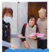
「お誕生日訪問」13名の福祉推進員が見守っています!

六番通りの中間に位置する町内会です。町内には保育園や幼稚園などもあり、「夏祭り」や「ふれあいの集い」など多世代の交流を大切にしています。