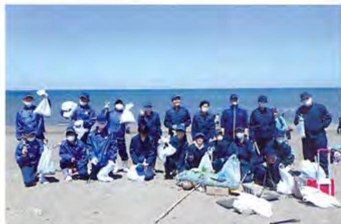
▲青い空、青い海、きれいなビーチ。力を合わせてグリーンアップ大成功!