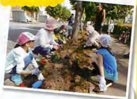
子供たちと花壇の整備

月2回のサロン活動、ポイント券システムでのご近所助け合い活動、日常の見守り活動、入学祝いや出産祝い、子ども向けのクリスマス会、災害時要支援者避難の仕組み作りなど、安心して暮らせる住みよいまちづくりのために活動しています。