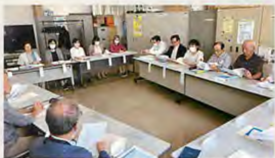
▲ボランティア企画部の打合せ会議の様子