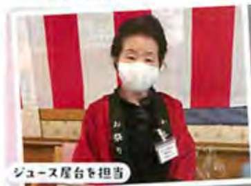
ジュース屋台を担当