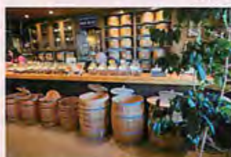
▲生豆の入った樽が並ぶ店内