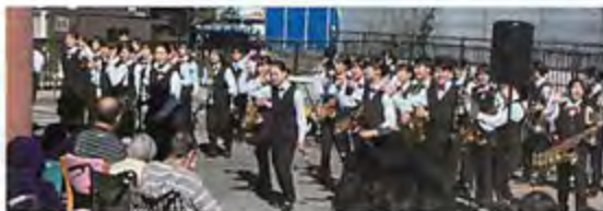
札幌国際情報高等学校 吹奏楽部のダンプレ