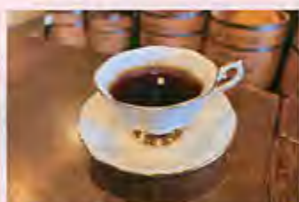
▲透き通った輝きを放つオリジナルブレンド「豆の木」(中煎り焙煎)

フレッシュ ロースト コーヒー まめ き Fresh Roast Coffee 豆の木