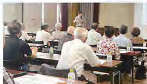
▲セミナーの様子 熱心に聞き入る参加者の皆さん