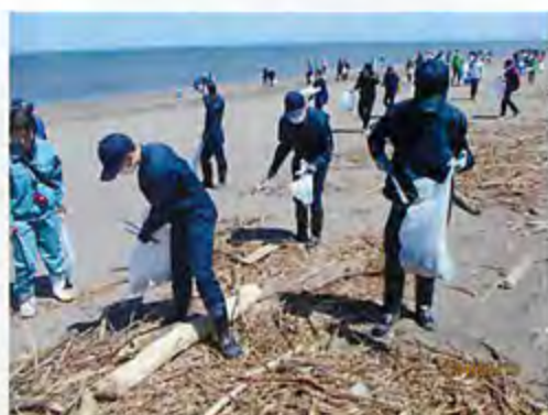
▲どんどんゴミが溜まっていきます