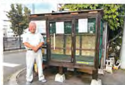
▲出村会長。会長自作のごみステーションの前で