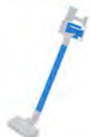
コードレス掃除機